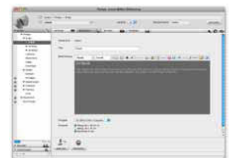
Intuitive Benutzeroberfläche zum Einrichten von Web-Sites im Pixtacy-System

Ob nun für Fotografie als gewerbliche oder künstlerische Leistung oder für Software, vor dem wirtschaftlichen Erfolg geht es um