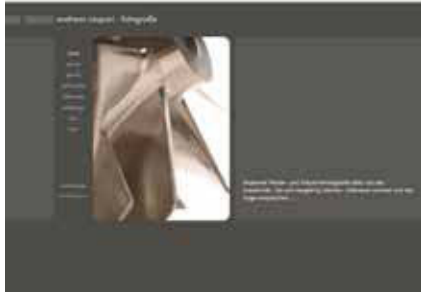
Die Web-Site Andreas Caspari nutzt Pixtacy für den Kundenzugang

„Ohne die Teilnahme am Value!Circle und diese vergleichsweise geringe Investition, wären wir erst viel später auf die Idee gekommen, die Verschlagwortung von Fotos an externe Dienstleister zu delegieren“, gestand das Pixtacy-Team ein. „Nach der Value!Circle-Teilnahme haben wir unsere Prioritäten neu geordnet und die Aufgabenliste ergänzt.“ So werden Pixtacy-Anwender in den Genuss von Schnittstellen und einer übergreifenden Vermarktungsplattform für Fotografen kommen. Dort werden Pixtacy-Nutzer ihr Angebot zukünftig auf der gemeinsamen Plattform »pixtacy.net« präsentieren können – und so noch leichter im Web gefunden.